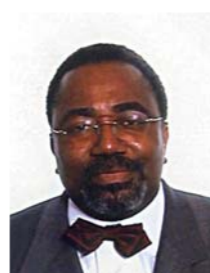
Rodolphe ADADA Ministre d'Etat, ministre des affaires étrangères et de la francophonie