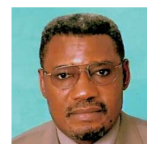
Charles Zacharie BOWAO Ministre à la présidence, chargé de la coopération, de l'action humanitaire et de la solidarité