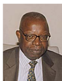
Jean-Baptiste TATI LOUTARD Ministre d'Etat, ministre des hydrocarbures