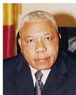
Isidore MVOUBA Premier ministre, chargé de la coordination de l'action du gouvernement et des privatisations