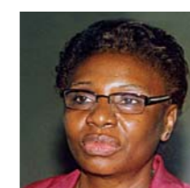
Rosalie KAMA-NIAMAYOUA Ministre de l'enseignement primaire et secondaire, chargée de l'alphabétisation