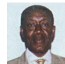
Justin BALLAY MEGOT Ministre à la présidence, chargé de l'intégration sous-régionale et du NEPAD