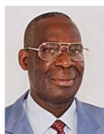
Général de division Florent NTSIBA Ministre de l'équipement et des travaux publics