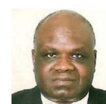
Emile OOUSSO Ministre des transports et de l'aviation civile