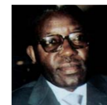
Gabriel ENTCHA-EBIA Ministre des postes et télécommunications, chargé des nouvelles technologies de la communication