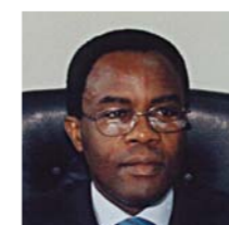
Louis-Marie NOMBO MAVOUNGOU Ministre des transports maritimes et de la marine marchande