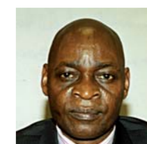
Pierre Ernest ABANDZOUNOU Ministre de la recherche scientifique et de l'innovation technique