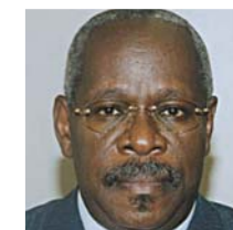
Lamyr NGUELE Ministre de la réforme foncière et de la préservation du domaine public