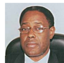
Pierre Michel NGUIMBI Ministre de l'enseignement technique et professionnel