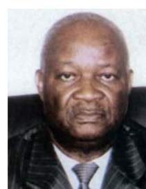
Maître Aimé Emmanuel YOKA Ministre d'Etat, garde des sceaux, ministre de la justice et des droits humains