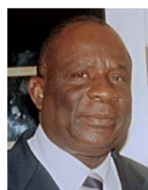
Pacifique ISSOIBEKA Ministre de l'économie, des finances et du budget