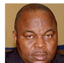
Bruno Jean Richard ITOUA Ministre de l'énergie et de l'hydraulique