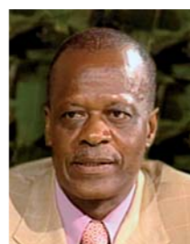
Henri DJOMBO Ministre de l'économie forestière