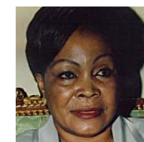
Adélaïde MOUNDELE-NGOLLO Ministre du commerce, de la consommation et des approvisionnements