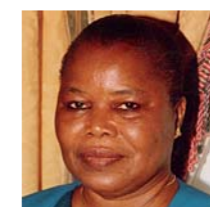
Jeanne Françoise LECKOMBA LOUMETO-POMBO Ministre de la promotion de la femme et de l'intégration de la femme au développement