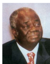
Jean-Martin MBEMBA Ministre d'Etat, ministre de la fonction publique et de la réforme de l'Etat