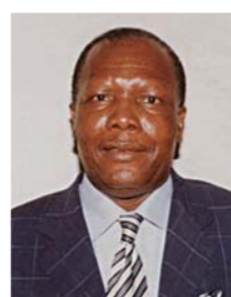
Général de division Pierre OBA Ministre des mines, des industries minières et de la géologie