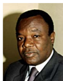
Claude Alphonse NSILOU Ministre de la construction, de l'urbanisme et de l'habitat