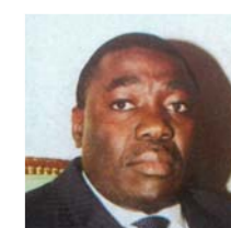
Gilbert ODONGO Ministre du travail, de l'emploi et de la sécurité sociale