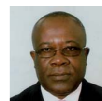
Philippe MVOUO Ministre de la pêche maritime et continentale