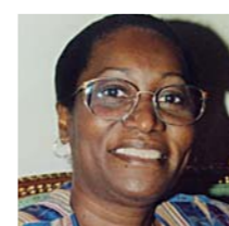
Emilienne RAOUL Ministre de la santé, des affaires sociales et de la famille