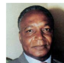
Henri OSSEBI Ministre de l'enseignement supérieur