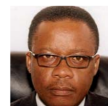
Alain AKOUALA-ATIPAULT Ministre de la communication, chargé des relations avec le parlement, porte-parole du gouvernement