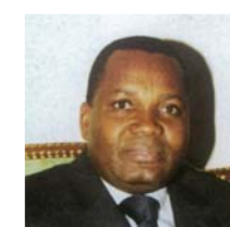
Jean Claude GAKOSSO Ministre de la culture et des arts