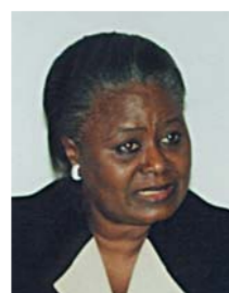
Jeanne DAMBENZET Ministre de l'agriculture et de l'élevage