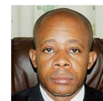
Martin Parfait Aimé COUSSOUD MAVOUNGOU Ministre des petites et moyennes entreprises, chargé de l'artisanat