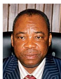
Pierre MOUSSA Ministre d'Etat, ministre du plan et de l'aménagement du territoire