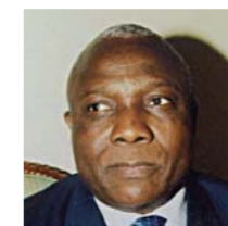
Général de division Jacques Yvon NDLOLO Ministre à la présidence, chargé de la défense nationale, des anciens combattants et des mutilés de guerre